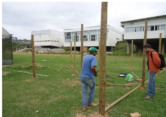
FIGURA 2. Montagem do protótipo da ecosala no campus São Roque do IFSP.

Após a montagem da estrutura básica é feita a ligação de energia e água na rede normal (um ponto de cada). Adicionalmente pode ser comprado uma placa solar e montado um sistema de coleta para a água. As estruturas de telhado e as primeiras duas paredes são feitas durante o primeiro curso de Bioconstrução.