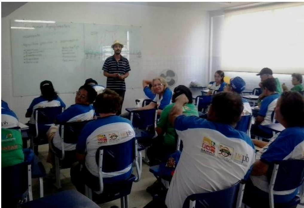
FIGURA 2. Discutiendo Agroflorestas con idosos da turma da UAMA/Campus II/UEPB

As atividades com esta turma continuam até o final do semestre letivo 2015.1 e, com certeza, vai proporcionar ainda mais aprendizado.