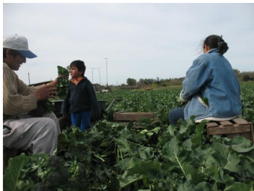
FIGURA 3: Familia productora de la localidad de Arana, que vende en la Feria

“Manos de la Tierra” es producto de la organización de los/as productores/as en el Consejo Social, donde han identificado sus propias problemáticas (aquí nos referimos a la comercialización, aunque en el consejo productores y productoras abordan cuestiones de variada índole) y encontrado el modo de abordarlas. Esto no sólo ha generado un canal de comercialización más justo (debido a los mejores precios, la ausencia de intermediarios, la valoración de los productos en relación a su forma de producción, entre otros) sino que representa una forma de empoderamiento y un aumento de la autoestima para los/as feriantes, que intercambian sus saberes entre ellos/as y con los/as consumidores en la Feria.