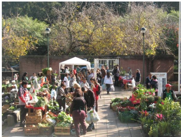
FIGURA 2: Feria Manos de la Tierra

Frente a estas condiciones, las familias comenzaron a participar comprometidamente superando el individualismo para actuar colectivamente en función de objetivos comunes, en este caso, la comercialización en condiciones más justas a las tradicionales. Surgió allí la idea de generar en el predio de la FCAyF una feria de productos de agricultura familiar, propia del proyecto, que permitiera un intercambio directo entre productores/as y consumidores/as. Más adelante, “Manos de la tierra” (como se bautizó a esta feria) crecería instalándose en la Facultad de Ingeniería (FI). Desde entonces, hasta la actualidad se pueden comprar, todos los miércoles en la FCAyF y los viernes en la FI, hortalizas frescas, plantas y flores, miel y huevos.