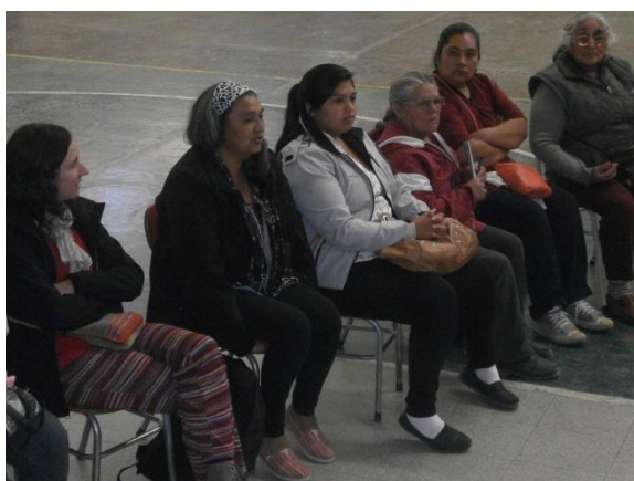
FIGURA 3. Encuentro de evaluación de la red, Gualjaina 2015.

El proceso de organización de la red conllevó a encuentros de evaluación y cierre de la temporada (figura 3), con la participación de todos los nodos, con diferentes dinámicas en cada uno de ellos; la realización de una feria de ferias en el 2012 en Trevelin y una feria de ferias en el año 2015 en Gualjaina (figura 4), con la participación de mucha población local, dada la relevancia del evento.