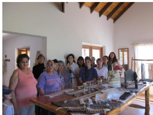
FIGURA 2. Encuentro de Capacitación del grupo de Feria de Los Cipreses.

La tabla 1 refleja a modo de ejemplo el estado de algunos nodos de la red de ferias y mercados a la presente temporada 2014/2015, mostrando los diferentes procesos en los que se encuentran los nodos