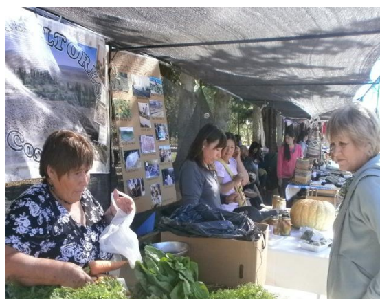
FIGURA 4. Feria de Ferias, Gualjaina 2015.

Los desafíos son muchos, en relación a los productos: uno de ellos es poder diseñar en forma consensuada un logo que identifique a la red, otro es elaborar un reglamento de funcionamiento, su estatuto y personería jurídica, su registro, entre otras tantos procesos a construir.