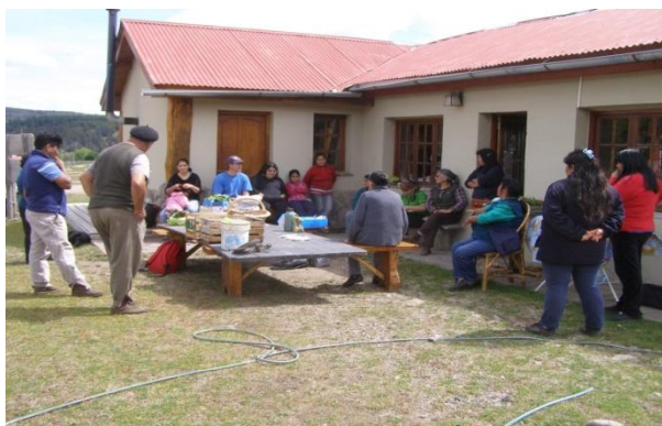
FIGURA 1. Feria: Encuentro de un mercado de la red en Lago Rosario.