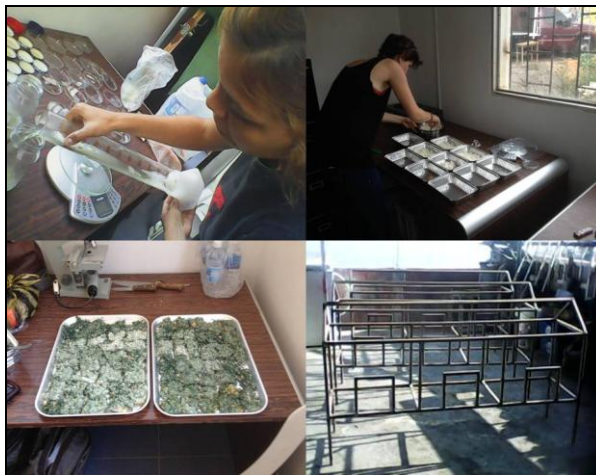
FIGURA 3: Experiencias en producción de Trichoderma y crías de Coccinélidos en el LAB.