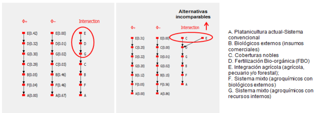
FIGURA 1. Jerarquización de alternativas de acuerdo a matriz multicriterio y matriz de equidad, con valores de \alpha = 0.5 .

Mientras, que al analizar la matriz de equidad (Figura A, derecha), se presenta incomparabilidad entre las alternativas de uso de coberturas nobles (C) y el sistema integral (E). No obstante, siguen ocupando los primeros lugares jerárquicos, junto con la fertilización bio-orgánica, prevaleciendo de esta forma la que utilizan recursos internos del sistema.