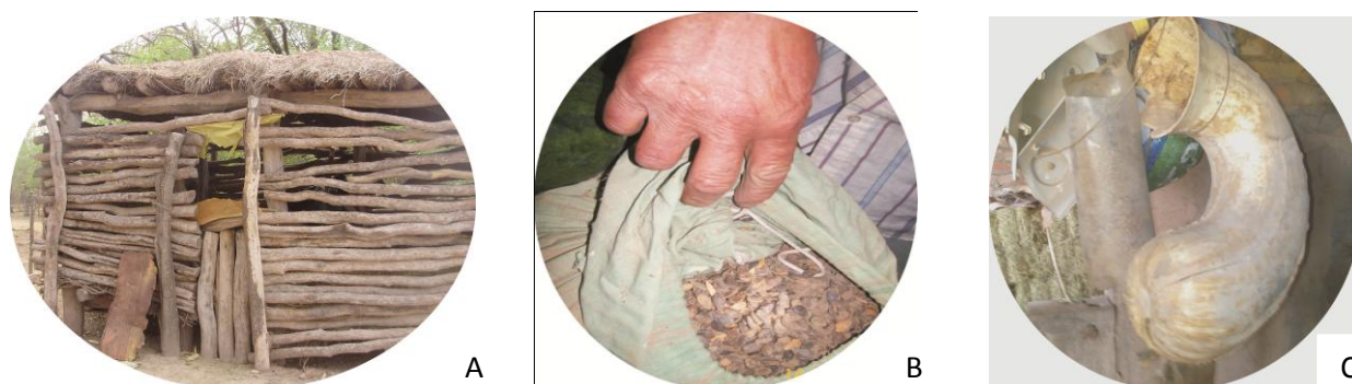
FIGURA 3. Formas de almacenamiento.

Las trojas son una de las estructuras de acopio observadas, que constituyen el sistema más antiguo de almacenamiento de maíz en la zona (Figura 3 A). Están confeccionadas de distintos materiales de acuerdo a los recursos y las posibilidades económicas de cada familia. Solo 5 familias encuestadas que cultivan maíz conservan esta práctica. La sanidad del material se controla con el uso de repelentes naturales: cenizas, “paico” ( Chenopodium anthelminticum ), “poleo” ( Mentha pulegium ) y el ahumado de los cuartos de almacenamiento (cocina, despensa).