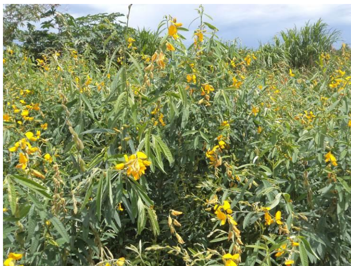
FIGURA 2. Especie de abono verde Crotalaria juncea en la propiedad del agricultor en Brasilia, Brasil. Embrapa Hortalizas, 2015.