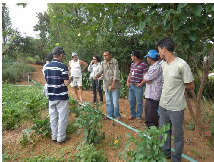
FIGURA 3. Taller de manejo y diversificación realizado en la propiedad del agricultor en Brasilia, Brasil. Embrapa Hortalizas, 2015.

Los indicadores utilizados en ese trabajo fueron la puerta de entrada para las discusiones sobre las prácticas sostenibles de producción. El grupo de agricultores es bastante diverso y va desde agricultores pequeños bastante diversos y comercialización directa hasta agricultores menos diversos y con canales de comercialización mas establecidos en las grandes plazas de comercialización. De modo general, la evaluación del suelo presentó un desequilibrio entre los componentes en todas las fincas estudiadas. Estos agricultores son convencionales en su forma de producción y ese ha sido una forma práctica de mostrar la necesidad de incremento da materia orgánica, como el uso de coberteras de suelo como los abonos verdes. En este contexto, fue presentado las ventajas de uso de los abonos verdes y sembradas algunas áreas para muestra de las especies mas indicadas para la región.