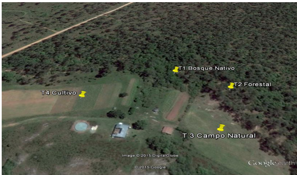
FIGURA 1. Ubicación del lugar y puntos de muestreo (Rivera, Uruguay).

El estudio se desarrolló en un predio del Instituto Nacional de Colonización en la zona rural de la ciudad de Rivera, Uruguay (Fig. 1) considerándose cuatro tratamientos de uso de suelo, Bosque Nativo, Forestal ( Eucaliptus sp.), Campo Nativo y Cultivo ( Ipomoea batatas ), donde se realizó recolección de muestras simples de suelo, a razón de una por tratamiento, georeferenciándolas para permitir su replicado, obtenidas a través de una sonda metálica (25x25x10cm).