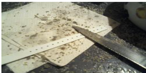
FIGURA 1. Detalle de una tira de PVC de plástico y cebo.

A los 15 días de la aplicación se procedió a la recolección de muestras de manera aleatoria, recolectando los primeros 5 cm de suelo (2 kg de suelo aproximadamente). Las muestras fueron tamizadas con un tamiz de 2 mm de abertura de malla, y defaunadas mediante freezer durante 2 días a una temperatura de -18 °C. Cada muestra se distribuyó en 4 vasos plásticos (400 gr) y se corrigió la humedad a 55 %. Se colocaron 4 lámina-cebo por vaso, al cual se le agregaron 5 lombrices ( Eisenia foetida ) de 7 meses de edad y clitelio desarrollado. Las muestras se mantuvieron a 21 °C durante 3 días para la posterior recolección de las láminas y recuento de cebos.