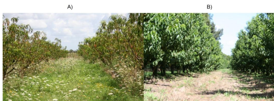
FIGURA 1. Fotos de montes de Prunus persica , donde A) corresponde al monte agroecológico y B) el monte convencional. Enero, 2015. Montevideo.

Se seleccionaron dos productores frutícolas del departamento de Montevideo, procurando que los manejos fueran diferentes. Uno de ellos se encuentra certificado por la Red de Agroecología, y adopta por lo tanto los principios agroecológicos, mientras que el otro es productor convencional. El estudio se centró en sistemas frutícolas de durazno ( Prunus persica ) (Figura 1). Se caracterizó el manejo de cada sistema para contrastarlos (Tabla 1).