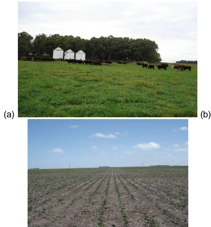
FIGURA 2. Sistemas productivos de la región pampeana argentina: (a) Parches forestales dispersos en un establecimiento mixto familiar; (b) Ausencia de parches forestales en un establecimiento agrícola empresarial.