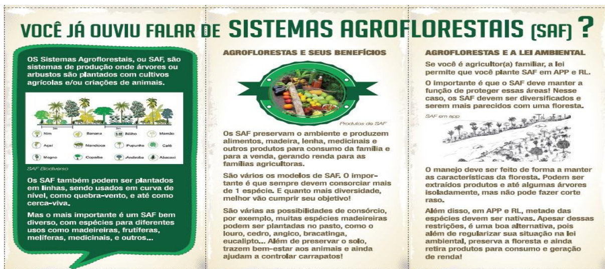
FIGURA 2. Vista interna do Folder informativo sobre sistemas agroflorestais e legislação relacionada, sendo o convite feito aos agricultores e agricultoras do Núcleo Luta Camponesa da Rede Ecovida para participarem do projeto "Elaboração de metodologia participativa para planejamento de sistemas agroflorestais em propriedades rurais familiares da região da Cantuquiriguaçu - PR"