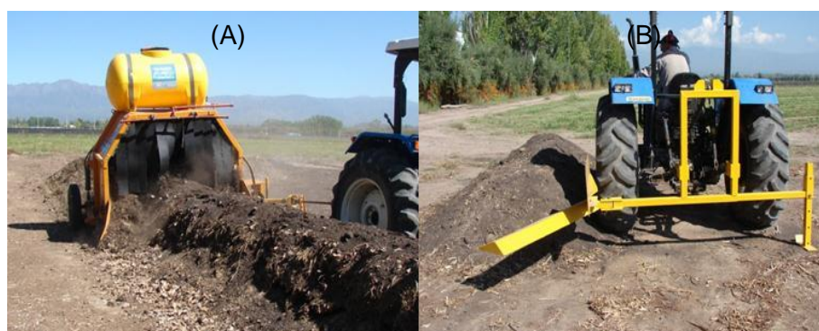
FIGURA 1. Mecanización del volteo de pilas de compostaje. (A) Máquina volteadora (EAA Hilario Ascasubi INTA), (B) Implemento tipo “reja” (EAA Mendoza INTA).