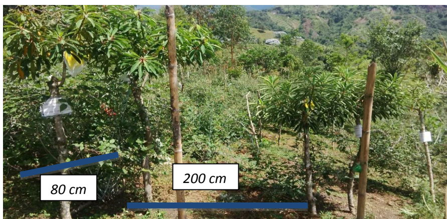
FIGURA 1. Distribución de tutores en campo